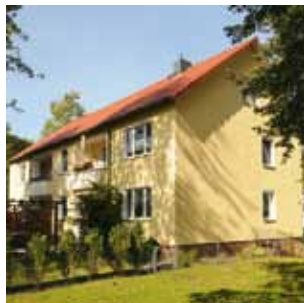
Schwanewede, Görlitzer Straße.

Einbau neuer Fenster und Balkontüren in die 286 Wohnungen wird noch vor dem Winter abgeschlossen sein. |