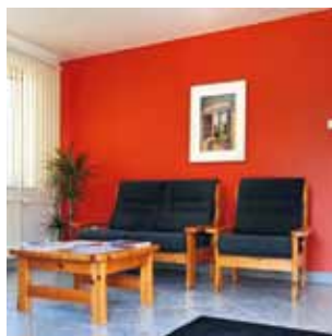
Mieterservice mit Besprechungsraum, Hannoversche Straße 24.

Fein abgestimmt hat er auch die umfangreichen energetischen Modernisierungsarbeiten in der Anlage. Seit 2010 wurden bei allen Häusern die Dachböden gedämmt. Der