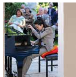
Großes Bild: Stipendiaten und Freunde.