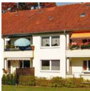
Schwanewede, Breslauer Straße.

INSBESONDERE die Senioren in Gundlachs-Wohnanlage in Schwanewede wird es freuen. Der Fahrdienst des Evangelischen Seniorenservice St. Johannes, den Gundlach unterstützt, bleibt auch weiterhin bestehen. Am jeweils ersten und dritten Mittwoch des Monats geht es jetzt zum Einkaufen und