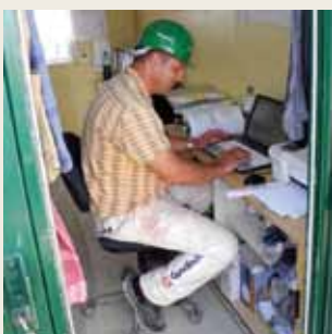
Im Bauwagen vernetzt: Moderne Baustellenkommunikation ist auch für die handwerkliche Ausbildung ein Muss.

stellten fachlich fundierte Fragen. Handwerk hat auch für Frauen goldenen Boden. |