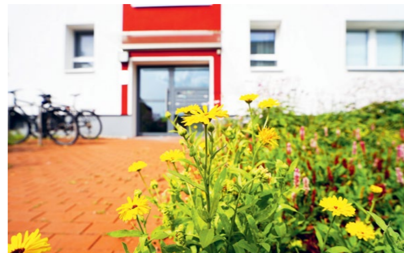
Unsere Blühwiesen wie hier in Ahlem liefern Insekten reichlich Nahrung. Insektenhotels ergänzen dies als sichere Nist- und Überwinterungsplätze für Wildbienen und andere Nützlinge.