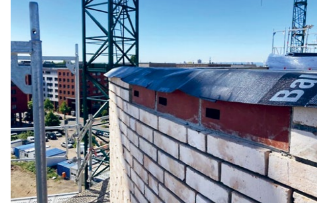
In unserem Bauprojekt »ZWEI« im Pelikan-Viertel haben wir Nisthöhlen für Mauersegler eingebaut. Diese Vögel nutzen ihre Brutplätze meist jedes Jahr aufs Neue!