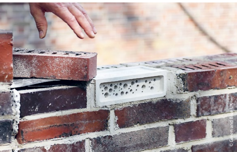
Mit dem Einbau von »BeeBricks« in die Mauern unserer Bauprojekte Herzkamp und Altenbekener Damm haben wir neue Nistplätze für Wildbienen geschaffen.

Besonderes Augenmerk legt Gundlach auf Nist- und Quartierhilfen. Unter anderem im Neubauprojekt ZWEI im Pelikan-Viertel wurden Nisthöhlen für Mauersegler integriert. Ein Projekt mit Zukunft: Die Vögel kehren erfahrungsgemäß jedes Jahr an ihre angestammten Brutplätze zurück. In Ahlem erleichtern spezielle Nisthilfen Schwalben das Brüten und machen ihr lebhaftes Treiben direkt erlebbar.