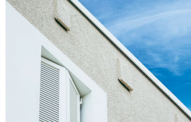
Fledermaushöhlen in Fassaden schaffen sichere Rückzugsorte für Arten wie den Abendsegler. Sie tragen wie hier in Bothfeld zum Erhalt der Tiere bei und bereichern die städtische Biodiversität.