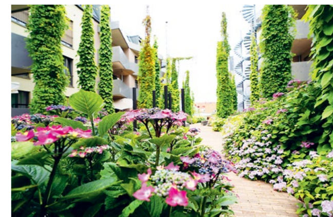
Im Projekt mitteNgrün in der City wachsen grüne Rankgerüste sogar in den Himmel.

Auch weniger sichtbare Stadtbewohner profitieren: In den Fassaden des Bauprojekts Herzkamp in Bothfeld wurden Fledermausquartiere geschaffen, etwa für den Abendsegler. Nicht zufällig trägt dort eine Straße den Namen Abendseglerweg. Zudem wurden bei der Planung die bekannten Laufwege von Igel berücksichtigt.