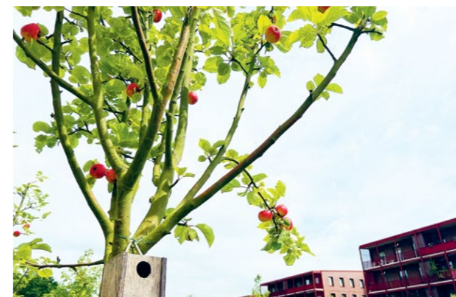
Fallobst bietet im Herbst wertvolle Nahrung für viele Tiere. Laubhaufen dienen Igel und Insekten als geschützter Rückzugsort und unterstützen so die Artenvielfalt.