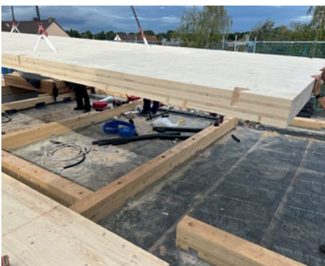
Vorgefertigte Holzelemente für das neue Geschoss

Schrittweise wird auf Wärmepumpen umgestellt, wobei die Heizkörper möglichst weiter genutzt werden. Den nötigen Strom liefern künftig Photovoltaikanlagen. Durch eine effiziente Wärmedämmung geht im Winter weniger Energie verloren und die Wohnungen heizen sich im Sommer weniger auf. So werden die Gebäude fit für den klimaneutralen Betrieb. Zusätzliche Geschosse in Holzbauweise schaffen Wohnraum, ohne mehr Flächen zu versiegeln.