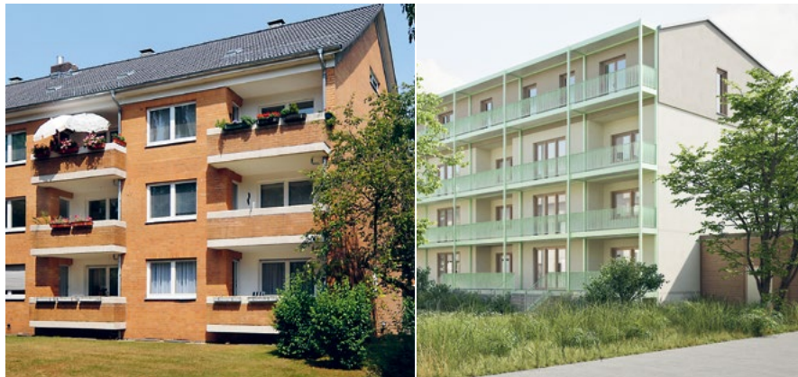
Vorher – nachher: Aufgestockt, in warme Dämmung eingepackt und mit großzügigen Balkons zeigt sich bald die gesamte Siedlung.

Eingeordnet ist »Aufwind« in einen klaren gesetzlichen und gesellschaftlichen Rahmen. Der Gebäudesektor verursacht rund ein Drittel der CO 2 -Emissionen in Deutschland. Bund und EU haben deshalb festgelegt, dass der Gebäudebestand spätestens 2045 klimaneutral sein muss, mit deutlich reduzierten Emissionen bereits bis 2030. Für Wohnungsunternehmen bedeutet das, ihre Bestände Schritt für Schritt weiterzuentwickeln. Gundlach geht diesen Weg aus eigener Überzeugung schon früher und konsequenter. Ziel ist es, die eigenen Wohnungen in der Region Hannover bis 2035 klimaneutral zu betreiben.