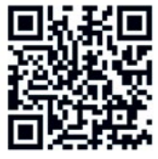
Bauherrin im Interview

Sports & Spa Architekturbüro: Rüßmann Architekten Bauherr: Pacific Spa GmbH Besonderheiten: Neubau eines ca. 3.500 m 2 großen Fitnessstudios mit zwei integrierten Innenhöfen, Außenpool und Außensauna. Kombierter Stahl- und Massivbau auf einer Grundfläche von ca. 73 x 38 m.